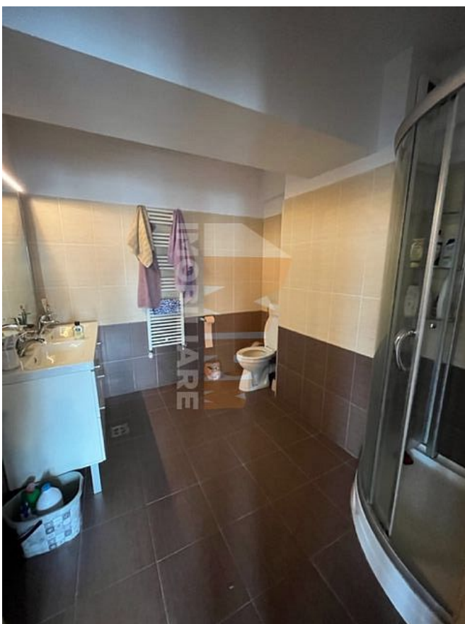
Oras: Cluj Napoca Cartier: Mărăști